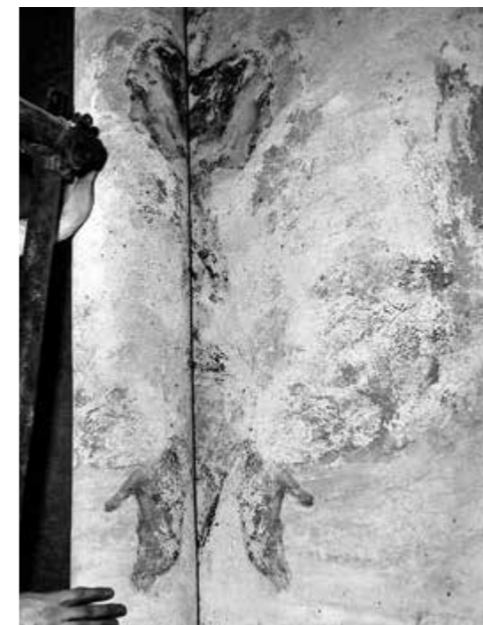
Milano, Certosa, particolare di una fase di strappo della lunetta affrescata nel 1629 da Daniele Crespi raffigurante l'incontro tra San Bruno e il Conte Ruggero I d'Altavilla, eseguito da Ottemi Della Rotta nel 1968. Archivi dell'Istituto per la Storia dell'Arte Lombarda (ISAL), Fondo Ottemi Della Rotta, cart. 22.01.

dell'Università Cattolica di Milano, di cui il volume Pitture Murali a Bre- ra curato da Fanny Autelli, con saggi introduttivi di Franco Mazzini e della stessa fondatrice di ISAL. Il progetto mirava a costituire un completo registro delle pitture murali di ambito lombardo non più esistenti nelle loro collocazioni originarie, incrociando i dati provenienti dagli archivi privati dei restauratori, in primis di Ottemi Della Rotta, con quanto pubblicato sul "Bollettino dell'Istituto Centrale del Restauro", sul "Bollettino d'Arte", nei differenti cataloghi delle mostre, negli elenchi e nelle schede delle Soprintendenze e dei Musei Civici. Attraverso uno studio approfondito delle fotografie del noto restauratore, inoltre,