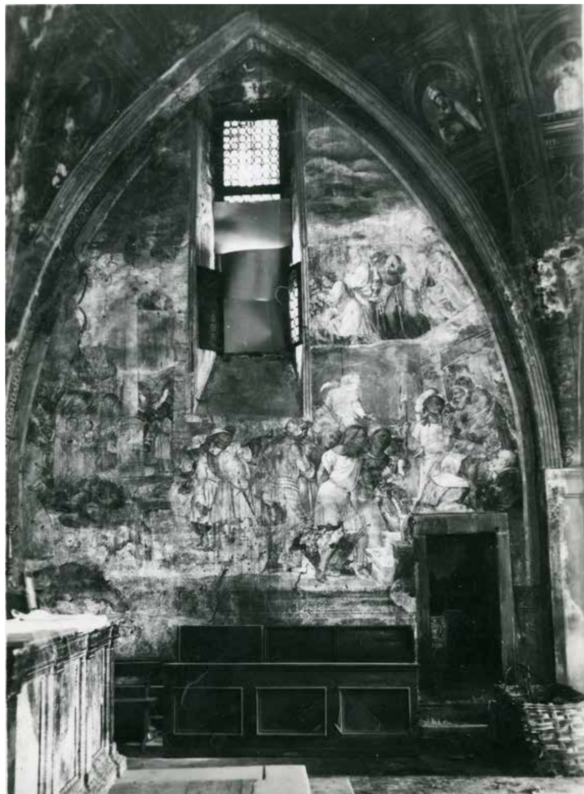
Breno, chiesa di Sant'Antonio Abate, particolare dell'area presbiteriale prima dell'intervento di restauro eseguito da Ottemi Della Rotta. Archivi dell'Istituto per la Storia dell'Arte Lombarda (ISAL), Fondo Ottemi Della Rotta, cart. 4.I.

Gavazzi 202 di proprietà della Fondazione IRCCS Ca' Granda Ospedale Maggiore Policlinico di Milano. Eccezione in questo oblio il restauro dell' Appartamento Borgia del Palazzo Apostolico nella Città del Vaticano, che oggi costituisce parte integrante del percor-