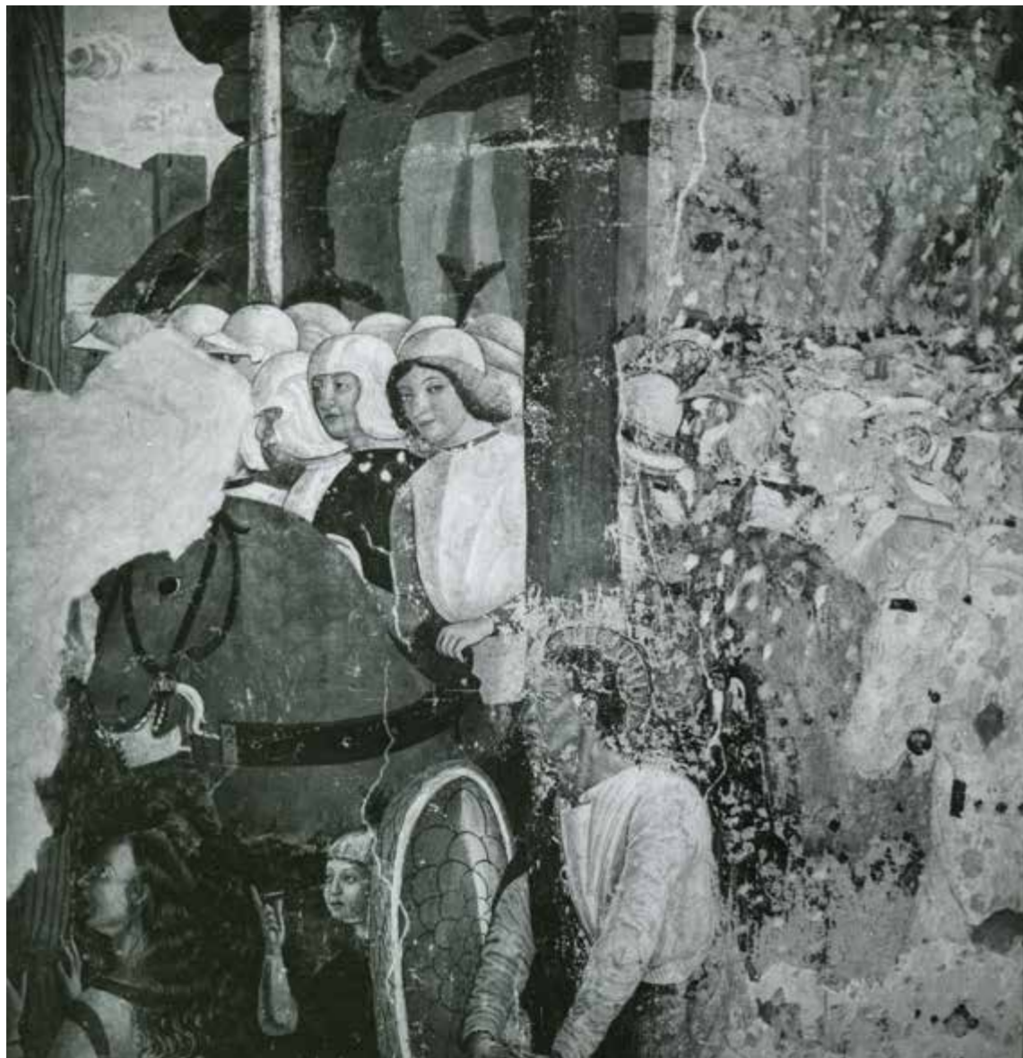
Bagolino, chiesa di San Rocco, particolare della decorazione pittorica durante le fasi di restauro eseguito da Ottemi Della Rotta.

Certosa di Milano, altrimenti nota come Certosa di Garegnano. Un intervento eseguito negli anni sessanta che per molti decenni è rimasto completamente ignorato dalla critica e che solo recentemente è divenuto oggetto di studio e valorizzazione scientifica. Nel trecentesco cenobio certosino, infatti, egli venne chiamato a lavorare a più riprese iniziando ad operare sulle decorazioni pittoriche della Sala Capitolare e della Cappella dell'Annunciazione e del Santo Rosario , lasciando limitate testimonianze visive anche nell'archivio fotografico parrocchiale. Sul finire del 1968